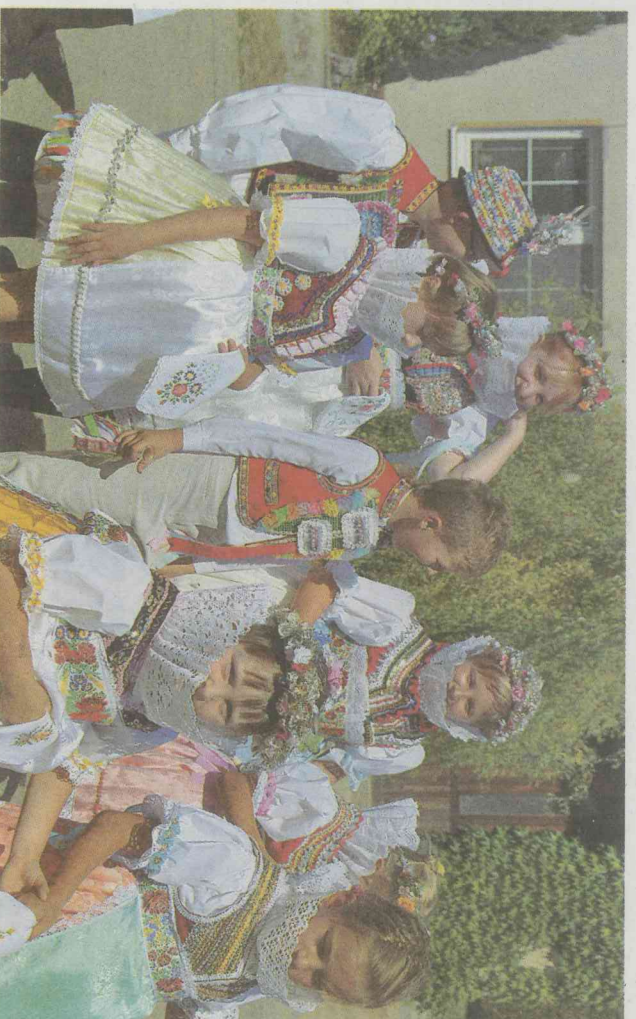
Na tradičních krojovaných hodcích lze ještě spatřit bohaté lidové kroje a tance.