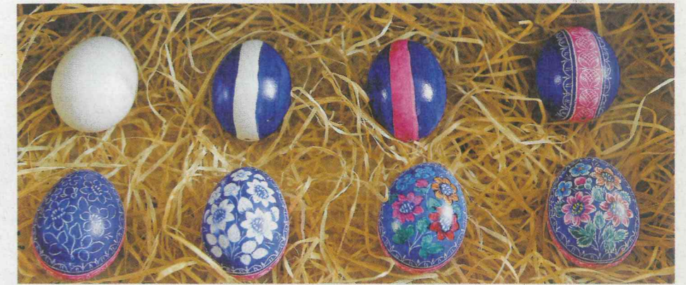
Borkovanské kraslice jsou unikátní zejména svou barevností.